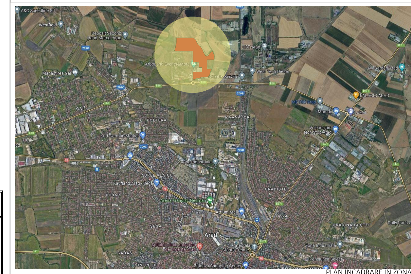
PLAN ÎNCADRARE ÎN ZONĂ

AMPLASAMENT: JUDEȚ ARAD, MUNICIPIUL ARAD, IDENTIFICAT PRIN CF 342301, 347549, 348667, 348671, 348672, 348673, 348675, 348676, 348677, 348680, 348681, 348682, 348683, 348684, 348685, 348686, 348687, 348688, 348689, 348690, 348691, 348692, 348693, 348694, 348695, 348698, 348699 Arad