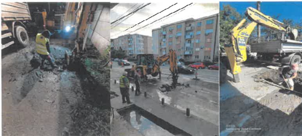
Măsurile de protecție a instalațiilor împotriva înghețului

Remedierea avariilor apărute la rețeaua de distribuție apă potabilă. Utilizatorii au fost informați despre întreruperea în furnizarea serviciului de alimentare cu apă prin intermediul paginii web CAA, a paginii oficiale de Facebook a Companiei de Apă Arad și sunt transmise prin email și către DSP Arad.