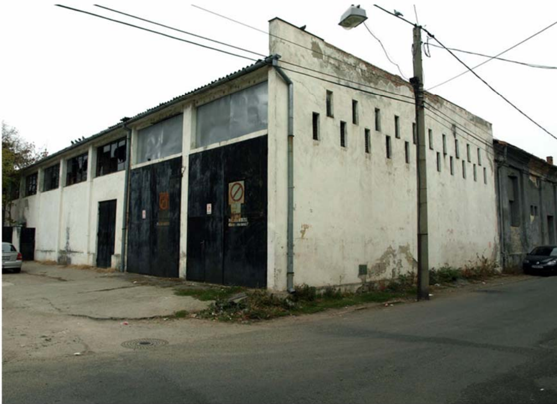
Spațiu magazie decor și garaj TCIS ARAD