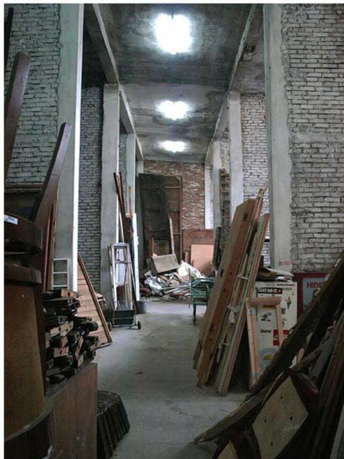
Detaliu interior, vedere de la intrare