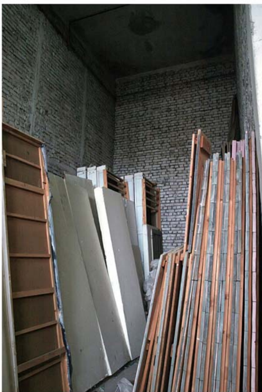
Detaliu interior, compartimentele de depozitare